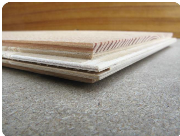
Particolare del sistema brevettato di profilatura

Incastro maschio femmina, con sistema brevettato a spigolo vivo o bisellato su 2 e/o 4 lati.